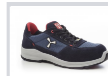
S0300 MARINEBLAU/SEA PORT